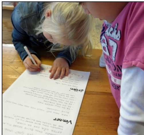
Pige underskriver klassens trivselskontrakt

Projektet strakte sig over 14 dage, 3-4 dage pr. uge, hvor grupperne skiftedes til at være de forskellige steder.